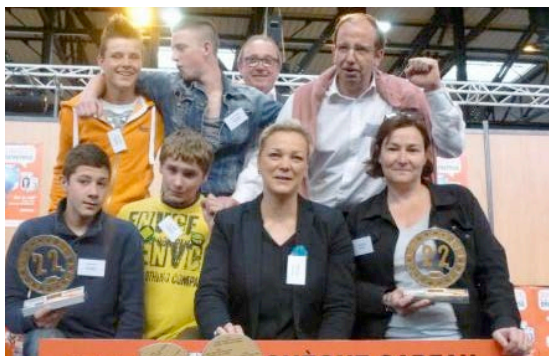
PUBLIÉ LE 15/06/2013 - La Voix du Nord

Le Bravo d'Or a été remporté par les élèves de 3 e voie professionnelle du Lycée Dampierre : ils ont conçu et fabriqué du mobilier de jardin, dénommé Sevelgarden, à partir de palettes de récupération et destiné aux salariés de Sevelnord lorsqu'ils prennent leurs repas à l'extérieur. Les élèves vont d'ailleurs continuer cette fabrication durant la prochaine année scolaire ; le bénéfice des ventes sera reversé au Téléthon.